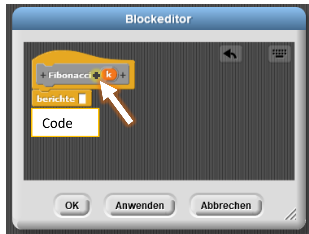
Abbildung 2: Mit dem + kann man eine Eingabevariable definieren. Der Befehl "berichte" gibt einen Wert zurück.