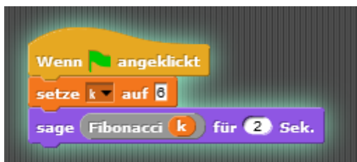
Abbildung 3: Um die Funktion verwenden zu können, musst du sie aufrufen. Du kannst hier das Ergebnis gleich von Sprite sagen lassen.

Hinweis: folgende Struktur in Pseudocode kann dir helfen!