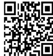
Abbildung 4: QR-Code

Auch der heute sehr häufig verwendete QR-Code (Abkürzung für „Quick Response“ – schnelle Antwort) ist eine etwas kompliziertere Form der Codierung.