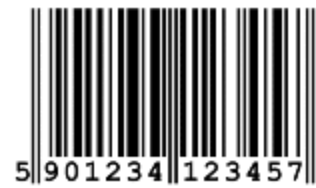
Abbildung 3: Europäische Artikel Nummer

Ein weiteres Beispiel, das jeder kennt, ist der Strichcode oder „ Europäische Artikel Nummer (EA-Nummer) “, der auf allen Produkten im Supermarkt zu finden ist. Mithilfe diese Codes können jedes Produkt und der zugehörige Preis durch einen Scanner an der Kasse erkannt werden.